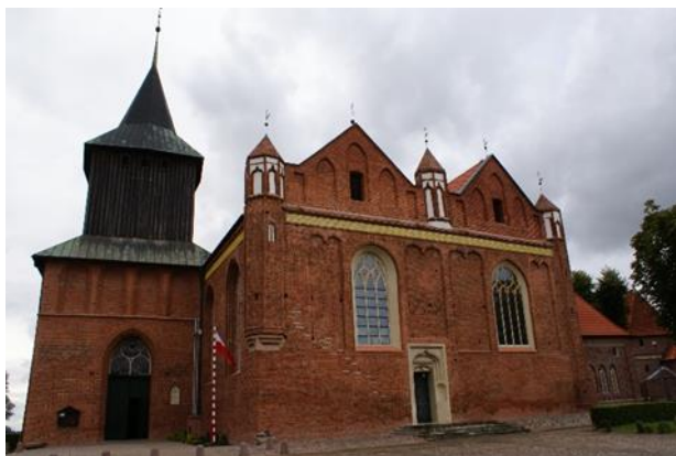
fot. Kościół św. Jana Chrzciciela w Malborku

Określ styl przedstawionych poniżej obiektów, prawdopodobny czas ich budowy oraz opisz charakterystyczne cechy obiektów budowlanych w Polsce w tym okresie. Podaj po jednym innym przykładzie znanych Ci obiektów budowlanych w tych stylach.