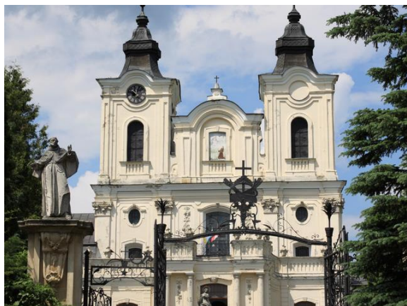
fot. Kościół i Klasztor Bernardynów w Dukli