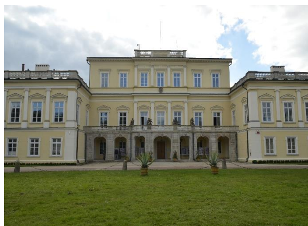
fot. Pałac Czartoryskich w Puławach